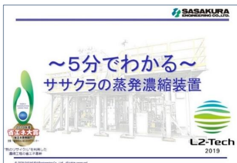
出展ページ：蒸発濃縮装置