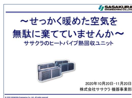
出展ページ：ヒートパイプ式熱回収ユニット